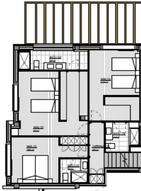
PLANTA PRIMERA ESCALA 1:100_A0