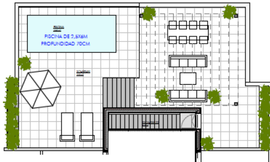
PLANTA SOLARIUM FIGURA 1.102_03