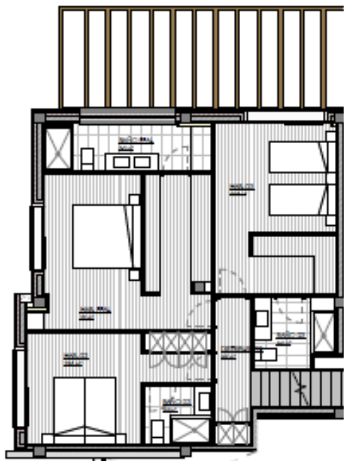
PLANTA PRIMERA FIGURA 1.102_01