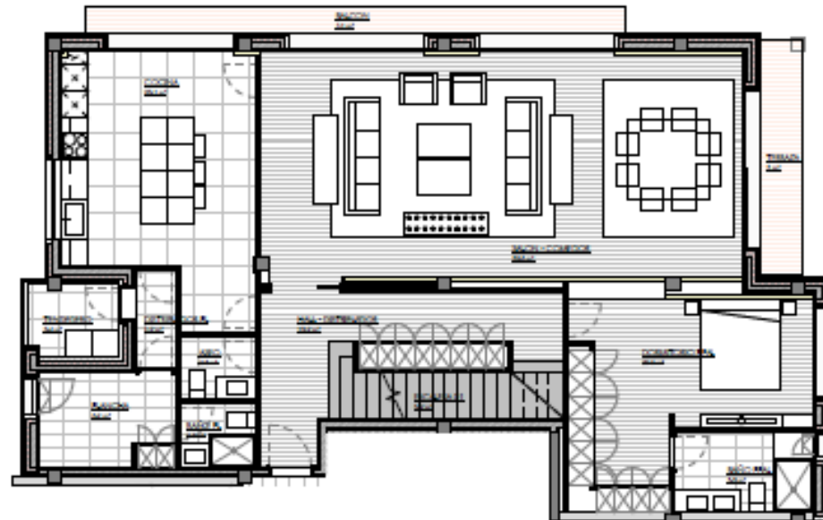
PLANTA SEGUNDA ESCALA 1:100_A0